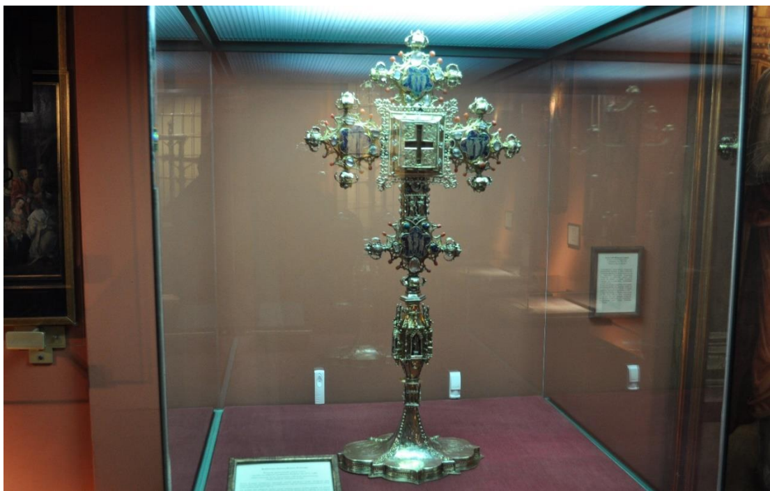
Fot. 15. Krzyż Grunwaldzki w Domu Długosza w Sandomierzu (Fot. C. Jastrzębski).