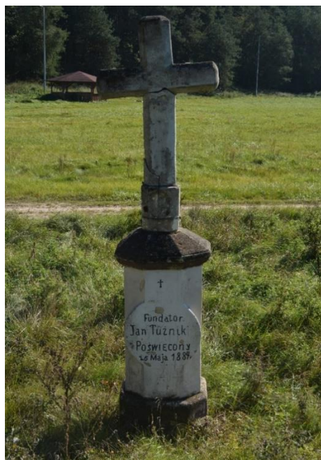
Fot. 10. Linów, Krzyż na postumencie ufundowany przez Jana Tużnika, poświęcony w 1884 r.

Kamienna figura przydrożna św. Jana Nepomucena na postumencie. Zapewne z XVIII w.