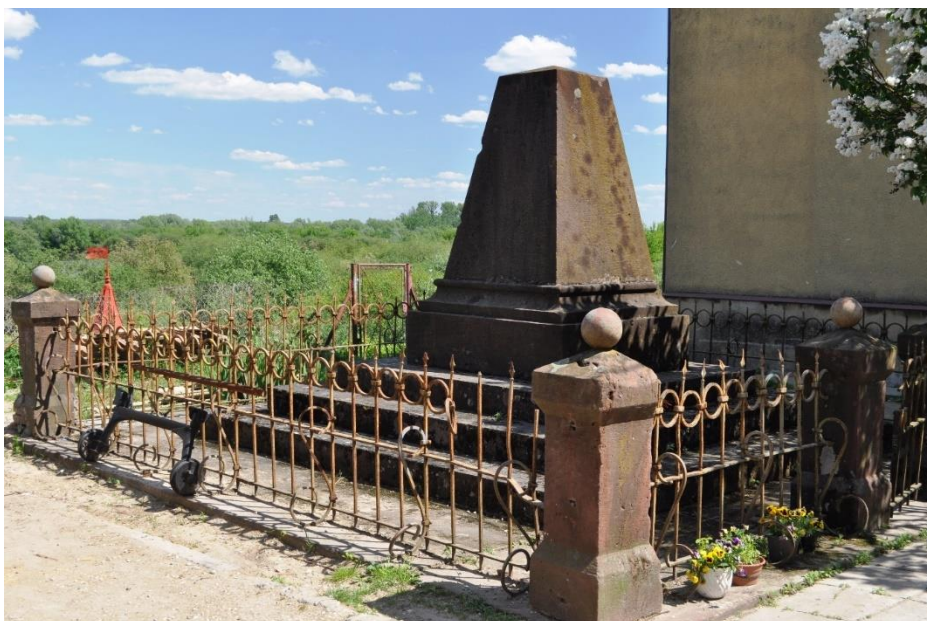
Fot. 11. Rosyjski reper w Zawichoście

Inne obiekty kulturowe z obszaru planowanego parku znajdują się w wielu miejscowościach: Biedrzychowie, Słupi Nadbrzeżnej, Cieszycy i in.