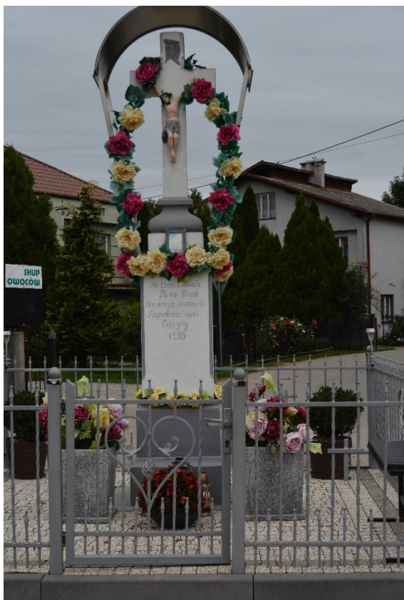
Fot. Krzyż kamienny na postumencie, Cieszyca