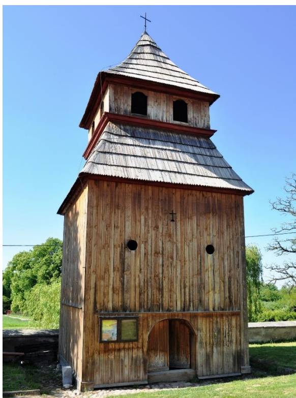
Fot.8. Dzwonnica w Zawichoście – Trójcy (Fot. C. Jastrzębski).

O dwunastowiecznej metryce kościoła świadczą jej plan, technika malarska, materiał, portal i przekazy historyczne, choć obecny styl murowanej świątyni jest gotycki. Prezbiterium i zakrystia pochodzą z XVII w. Nawa została rozbudowana w XVIII w. Z tego czasu pochodzi też drewniana dzwonnica.