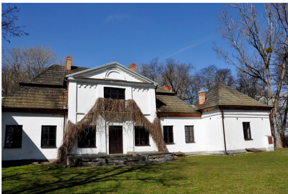
Fot. 7 Dwór w Skotnikach

Położony w pobliżu kościoła, otoczony pozostałościami parku krajobrazowego i fosą. Parterowy, założony na rzucie prostokąta z narożnymi alkierzami i piętrowym ryzalitem od frontu. Korpus główny nakryty łamanym dachem polskim, alkierze odrębnymi dachami namiotowymi, ryzalit dachem dwuspadowym. Dachy pokryte gontem. Elewacja frontowa południowo-wschodnia, siedmioosiowa z płytkim trójosiowym piętrowym ryzalitem. Na piętrze balkon. Piętro zamknięte wydatnym gzymsem z arkadkowym fryzem. Ryzalit wieńczy trójkątny szczyt obwiedziony profilowanym gzymsem z dekoracją kostkową. W polu tympanonu półkolistą płyciną. Elewacja ogrodowa siedmioosiowa, pomiędzy alkierzami poprzedzona tarasem ze schodami. Naroża alkierzy od strony ogrodu ujęte szkarpami. Układ przestrzenny stanowi obszerna sień na osi z parami pomieszczeń po bokach. W alkierzach pomieszczenia jednoprzestrzenne. W alkierzu południowo-zachodnim pozostałości sgraffitowego fryzu z przedstawieniem tańczących nimf.