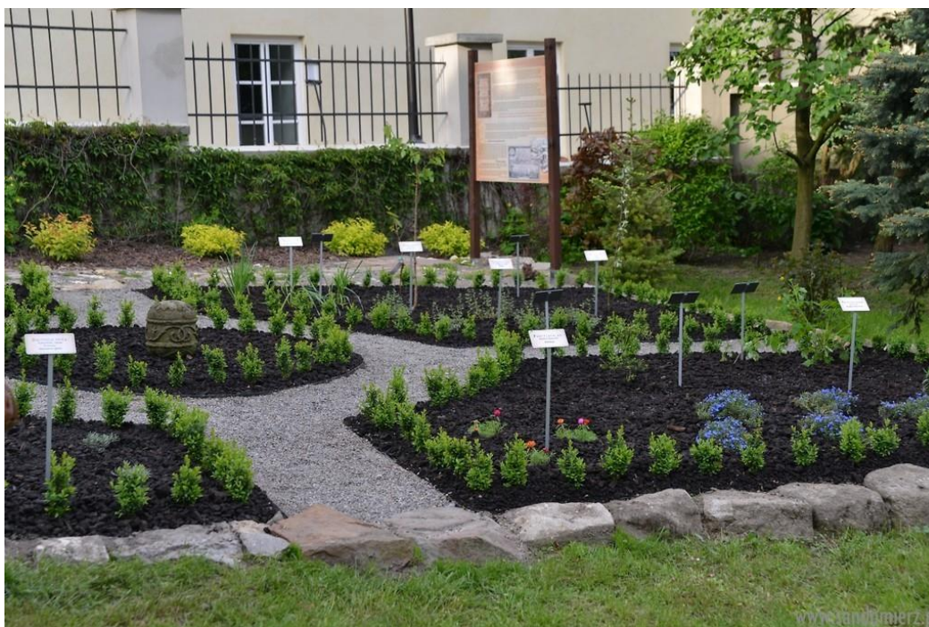
Fot. 2. Sandomierski Ogród kanonika Marcina z Urzędowa, 2015 r.