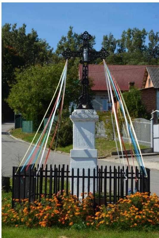
Fot.12. Krzyż żeliwny na postumencie, Biedzychów, 1862 r.