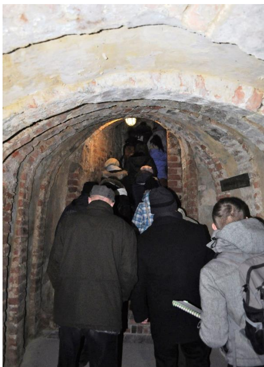
Fot. 5. Podziemna trasa turystyczna w Sandomierzu.

Pod względem rodzajowym lokalizacja przestrzenna zabytków nieruchomych projektowanego parku przedstawia się następująco: