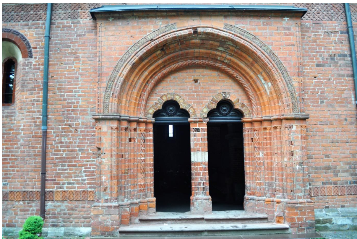
Fot.4. Portal kościoła p.w. św. Jakuba Apostoła Starszego w Sandomierzu (Fot. C. Jastrzębski).

wieku XX został poddany rekonstrukcji przywracającej pierwotny wygląd. Największe wrażenie robi wspaniały, późnoromański portal uskokowy nawiązujący do sztuki włoskiej. W kościele prezentowane są szczątki 49 dominikanów poległych męczeńską śmiercią podczas najazdu tatarskiego w 1260 roku. W posadzce odkryto tajemniczy wizerunek miecza. Gotycka płyta nagrobna w barokowej kaplicy wystawionej męczennikom oraz barokowy sarkofag wykonany z jednego kłosa dębowego poświęcone są księżniczce Adelajdzie. Kaplica świętego Jacka Odrowąża, pierwszego polskiego dominikanina, według tradycji została wystawiona w miejscu, gdzie znajdowała się jego klasztorna cela. Z dawnego klasztoru zachowało się tylko jedno skrzydło z licznymi relikwiami wczesnogotyckimi. W przytykającej do kościoła dzwonnicy znajduje się jeden z najstarszych polskich dzwonów. Klasztor został skasowany w ramach represji carskich po powstaniu styczniowym. Obecnie ponownie gospodarzami są dominikanie.