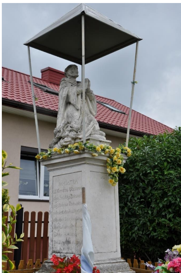
Fot. 9. Figura bł. Wincentego zwanego Kadłubkiem w Andruszkowicach.

Do ważniejszych obiektów z terenu projektowanego parku należą Andruszkowice . Jedną z najstarszych w Polsce figurą bł. Wincentego zwanego Kadłubkiem, z 1793 r.