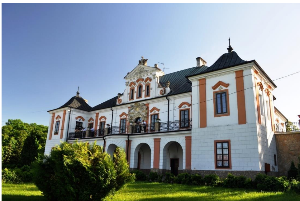
Fot. 6. Pałac w Czyżowie Szlacheckim.

Pałac wybudowany został w latach 1721-1751 przez Aleksandra Zaklikę, kasztelana braclawskiego, a następnie połanieckiego. Jego rozbudowę prowadzono w początkach XIX w. oraz w latach 1900-1922, 1922-1924. Od 1978 r. rozpoczęto prace rewaloryzacyjne. W sąsiedztwie pałacu odtworzono dawną oficynę.