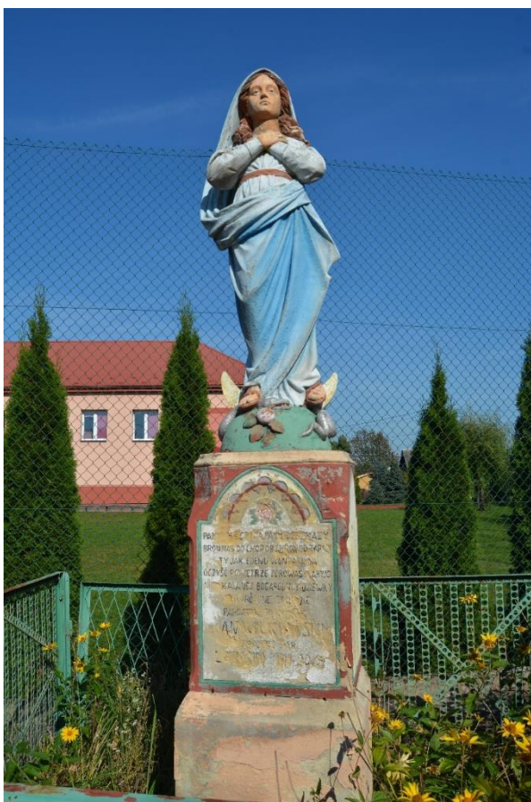
Fot.11. Krzyże, figury sakralne czy kapliczki stanowią nieodłączny element naszego krajobrazu. Figurka Matki Bożej, kapliczka murowana z pocz. XX w. Biedrzychów

Inne obiekty kulturowe z obszaru planowanego parku znajdują się w wielu miejscowościach: Biedrzychowie, Słupi Nadbrzeżnej, Cieszycy i in.