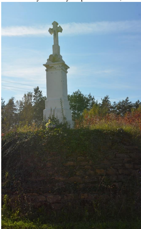
Fot. 13. Krzyż kamienny na postumencie, Słupia Nadbrzeżna pocz. XXw