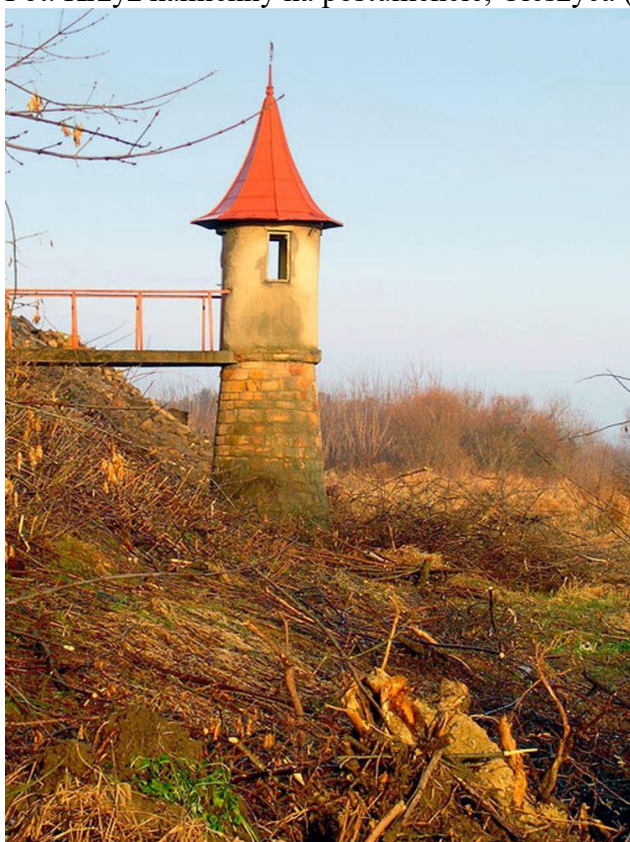
Fot. 14. Zawichost, odnowiony (wybudowany w 1924 r.), budynek wodowskazu mierzącego w przeszłości poziom wody w Wiśle.